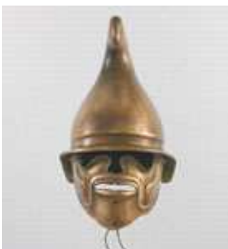
Ein thrakischer Helm

Der Schutz wurde komplettiert durch die Beinschienen, Knemides genannt.