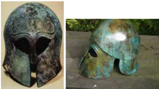
Zwei korinthische Helme

Ein anderer Helm war der chalkidische, welcher nun die Ohren frei ließ und so garantierte, dass der Träger auch hörte, was um ihn herum passierte. Noch weiter gehen die in klassischer Zeit aufkommenden Pilos-Helme, konische Stücke, die weder Wangenschutz noch Nasale kennen. Zu nennen sind außerdem noch die attischen, phrygischen und apulischen Helme.